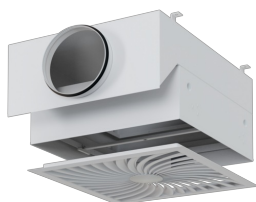
NAWIEWNIKI Z FILTREM ABSOLUTNYM