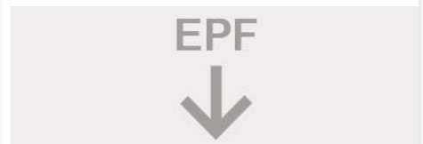
PROGRAMA DE DISEÑO EASY PRODUCT FINDER Más información y descarga