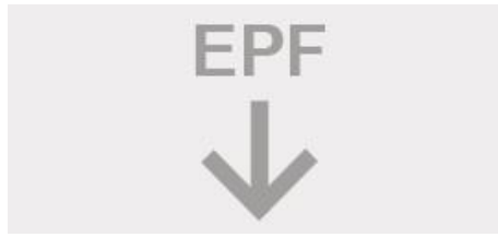
TROX EASY PRODUCT FINDER