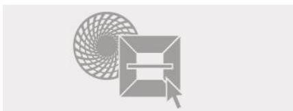
CONFIGURADOR ONLINE DE PRODUCTO Configure nuestros productos de manera sencilla