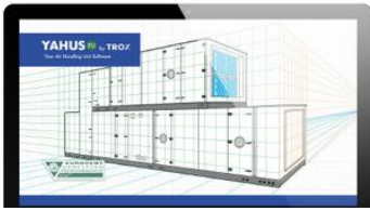
YAHUS EU Y TROX

Para facilitar la elaboración de proyectos HVAC y selección de nuestro amplio porfolio de productos y soluciones, ponemos a disposición de nuestros clientes el más completo conjunto de Herramientas de Selección y Prescripción. Programas para cálculo de unidades de tratamiento y distribución de aire (YAHUS y EPF), bibliotecas de producto en formato CAD, REVIT/BIM, tablas técnicas para dimensionado rápido, base de datos Presto, listas de precios, etc., facilitan el cálculo, medición, dibujo y cotización de nuestros productos.