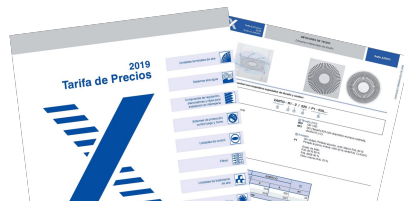
TARIFA DE PRECIOS TABLAS DE SELECCIÓN RÁPIDA